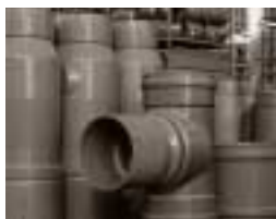
Stalafvoer 315 x 315.

Door heel Europa heen wordt in de afvoer van varkensstallen de bezande stalafvoer van Nyloplast verwerkt. De bezande spie zorgt voor een vloeistofdichte verbinding in de betonnen vloer.