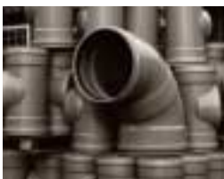
90 graden bocht 500 mm.

Deze daling manifesteerde zich met name bij de pvc systeemleveranciers en de betonproducenten en werd veroorzaakt door de aanhoudende daling in de woningbouw en de slechte situatie in de weg- en waterbouw in Nederland. Een stijging in de sector tuinbouw en de afzet van kolken en